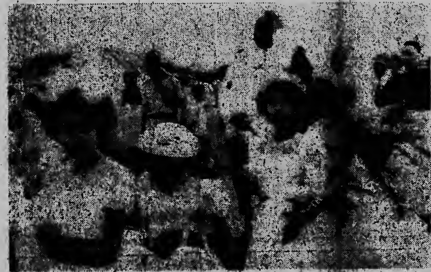
Aki nos ta mira e Obispo nobo huntu cu e bruidnan cu e bin duna bonbini na Savaneta.

SAN NICOLAS. - Aki ta sigui e lista di cosnan durante e periodo di 25 di Februari te 11 di Maart cu nan a hanja na San Nicolas: Un horlosi di armband Tears. Un sacu di cuminda di Galinja Layena Un boshi di jabi. Un papel di Fl. 5. - Un tas di dama color corra di cuero cu poeroe y jabi aden. Un carton conteniendo sacunan di papel.